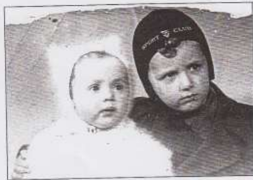
מרדכי ויהודית קסטנר