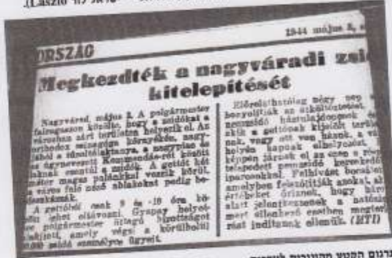
הרובם הקטע מהונגריה לעברית