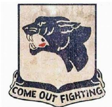
Emblema unității era o panteră neagră

Batalionul 761 a fost prima unitate de tancuri cu soldați de culoare trimisă vreodată într-o zonă de război. Unitatea a fost creată în aprilie 1942 și pregătită timp de doi ani înainte de a fi trimisă peste hotare. Aceste trupe știau că unitățile cu soldați albi erau trimise peste hotare după doar două sau trei luni de pregătire. Însă, în 1944, a existat o nevoie presantă de reîntăriri și, după o scurtă staționare a trupelor în Anglia, batalionul 761 a debarcat în Franța (Omaha Beach) la 10 octombrie 1944. Unitatea a ajuns (cu șase ofițeri albi, treizeci de ofițeri de culoare și 676 de bărbați de culoare înrolați) și a fost însărcinată cu sprijinirea Armatei a Treia americane de sub conducerea Generalului George Patton.